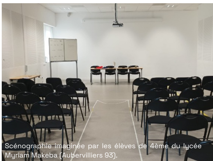
Scénographie imaginée par les élèves de 4ème du lycée Myriam Makeba (Aubervilliers 93).

La mise en scène de l'événement sportif est passionnante à analyser. Nous proposons aux participant.e.s de comprendre comment le sport est scénarisé afin qu'ils puissent à leur tour construire une image et la rendre spectaculaire.