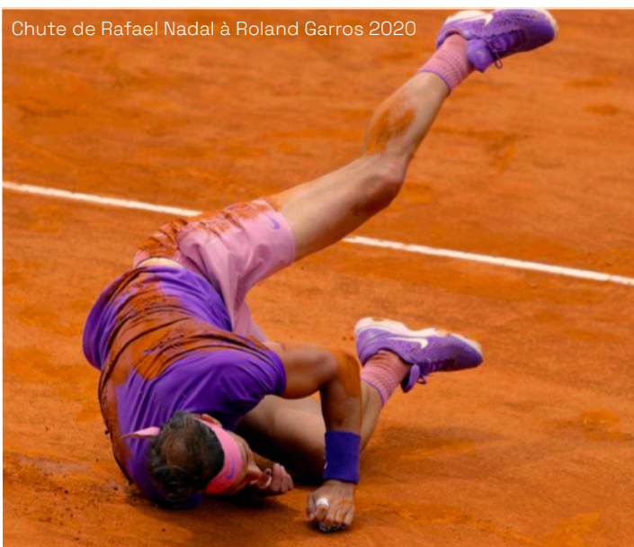
Chute de Rafael Nadal à Roland Garros 2020

Les comédiens dessinent et modèlent l'espace au fur et à mesure du spectacle. Par exemple, Ellen, suite à un différent avec Nathan, vient faire apparaître la ligne de milieu de terrain : alors qu'ils étaient dans un même espace, ils s'affrontent désormais face à face.